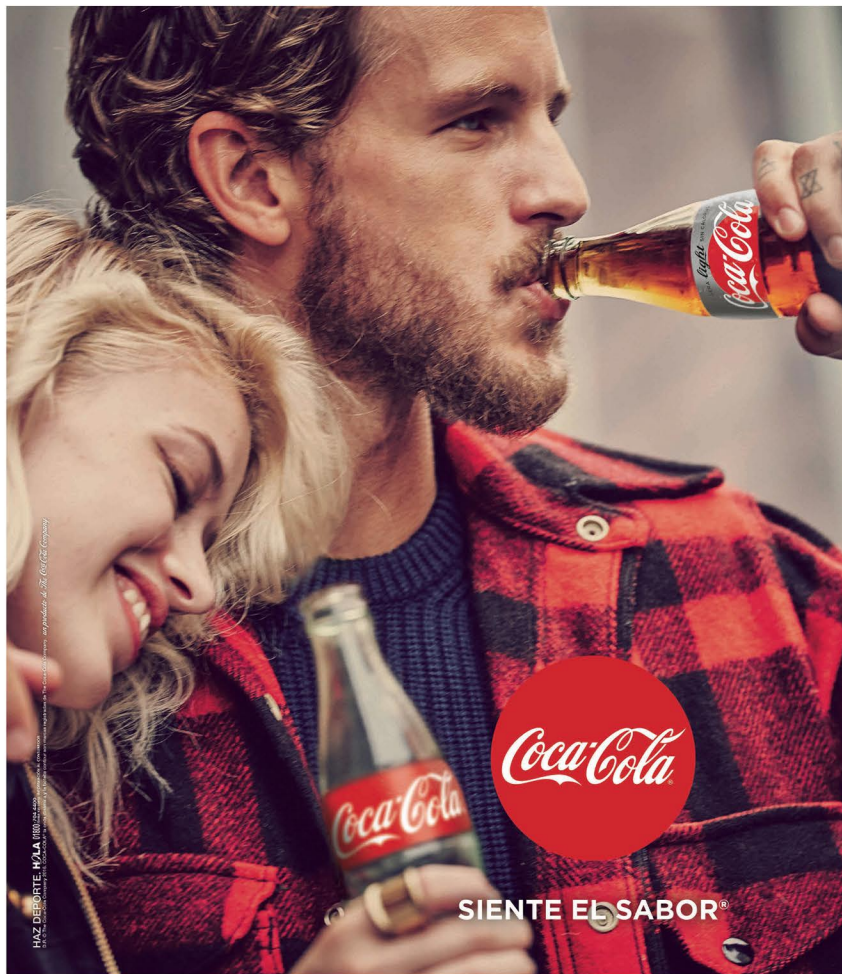
HAZ DEBORTE. N.A.L.A. (11/2017) © 2017 Coca-Cola Bottling Company U.S.A. All rights reserved. No other trademarks or registered trademarks are permitted. All trademarks are the property of The Coca-Cola Company.